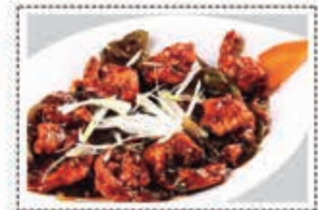
روبيان تشيلي CHILLI PRAWNS Dhs. 24.50/36