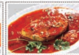
سمك مسالا (كنعد) FISH MASALA (KING FISH) Dhs. 14.00