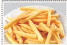
بطاطا مقبل FRENCH FRIES Dhs. 8.50/12.50