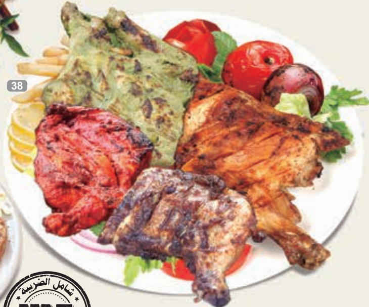
دجاج على الفحم مشكل خصوصن Our Special Mix Chicken Charcoal Dhs. 48.00