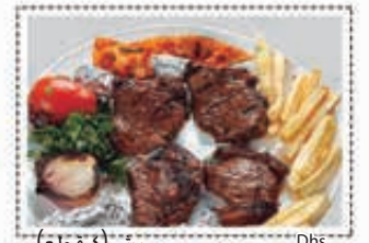
ريش (4 قطع) LAMB CHOPS (4 PCS) Dhs. 31.50