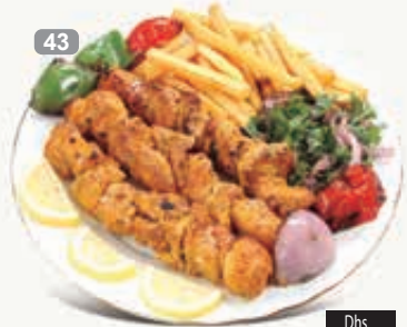
سمك تك Fish Tikka Yoghurt & Green Salad Dhs. 32.00