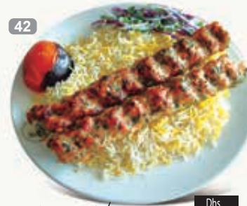
دجاج / لحم كباب شمالو Chalo Kabab Chicken/ Meat Yoghurt & Green Salad Dhs. 31.50