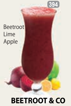
Beetroot Lime Apple