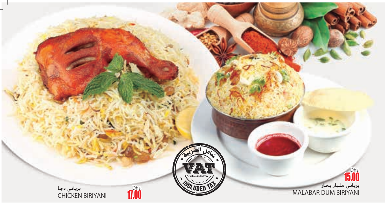
برياني دجا CHICKEN BIRIYANI