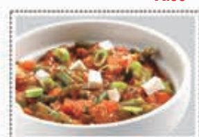
خضار مشكل MIX VEGETABLE Dhs. 10.00