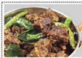
لحم مقلي MUTTON FRY Dhs. 19.00