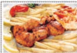
دجاج تكة CHICKEN TIKKA Dhs. 25.50

* Customers allergenic to certain food ingredients may please inform us * The above pictures are for illustrious purpose. It may vary in actual presentation