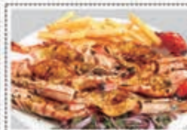
روبيان مشوي GRILL SHRIMPS Dhs. 37.00