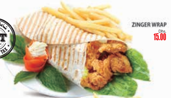
ZINGER WRAP Dhs. 15.00