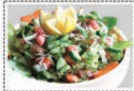
سلطة عرب ARABIC SALAD Dhs. 8.50