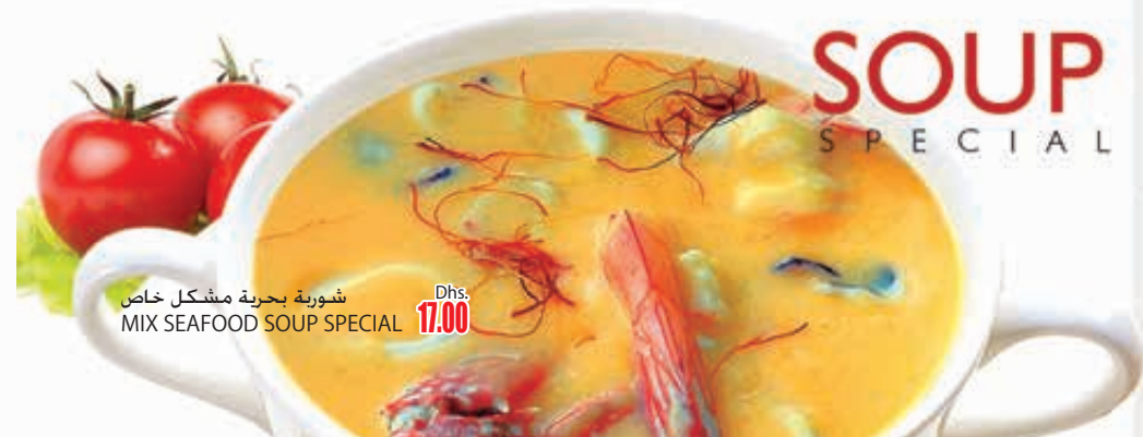
شورية بحرية مشكل خاص MIX SEAFOOD SOUP SPECIAL

"good soup is one of the prime ingredients of good living" Soup is a primarily liquid food, generally served warm (but may be cool or cold), that is made by combining ingredients such as meat and vegetables with stock, juice, water, or another liquid. Hot soups are additionally characterized by boiling solid ingredients in liquids in a pot until the flavors are extracted, forming a broth.