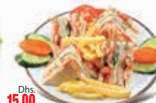
SHEESH TAWOOK CLUB