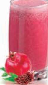
POMEGRANATE Dhs. 10.50/13