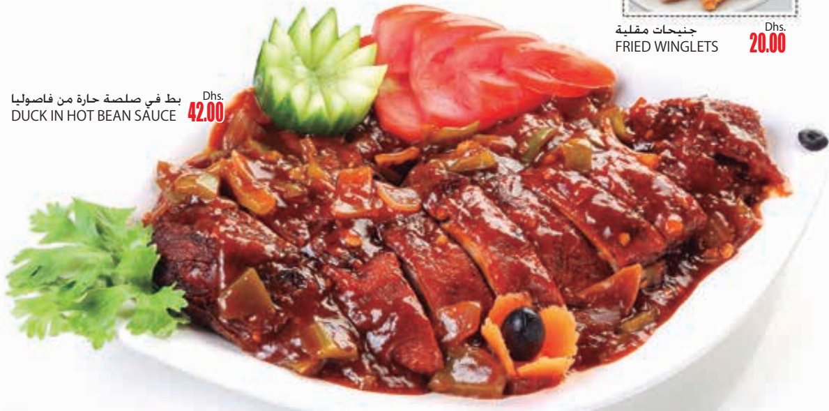
بط في صلصة حارة من فاصوليا DUCK IN HOT BEAN SAUCE Dhs. 42.00