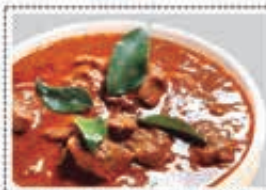
لحم بقر مسالا BEEF MASALA Dhs. 17.00