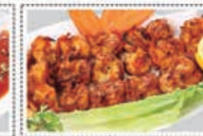
روبيان مقلي PRAWNS FRY Dhs. 23.00