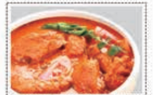
دجاج مسالا CHICKEN MASALA Dhs. 14.00