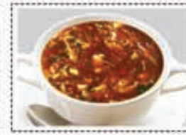
شورية حارة و حام HOT AND SOUR SOUP