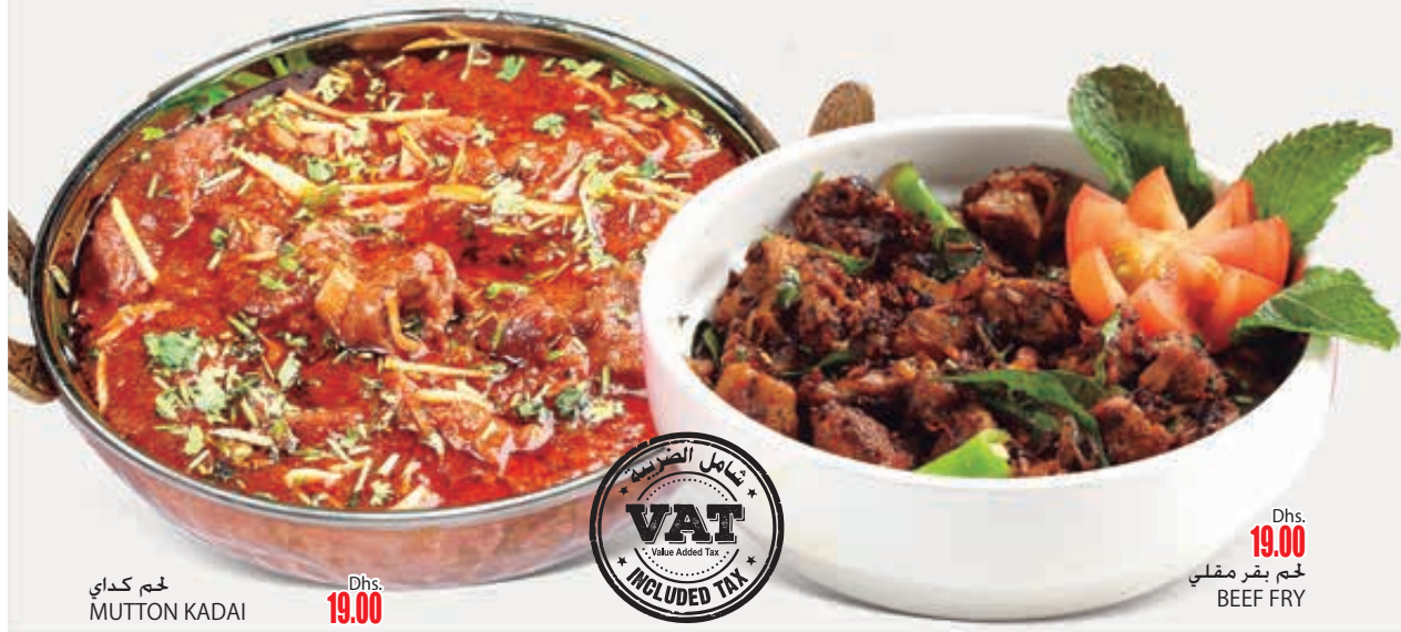
لحم كدائي MUTTON KADAI Dhs. 19.00