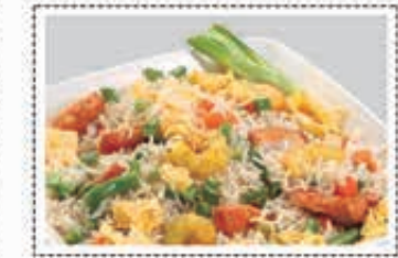
ارز مقلي مشكل MIXED FRIED RICE Dhs. 19/26.50