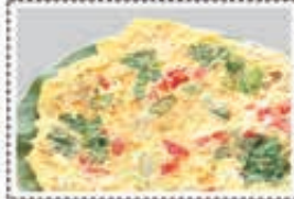
بيض مقبل OMELETTE Dhs. 7.50