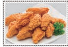
جنيحات مقليّة FRIED WINGLETS Dhs. 20.00