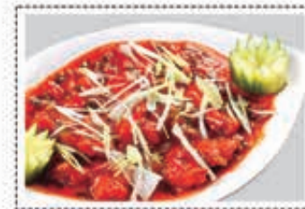
سمك و ثوم/زنجبيل FISH & GARLIC/GINGER Dhs. 23/29.50