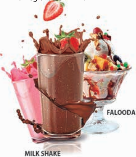
MILK SHAKE FALOODA