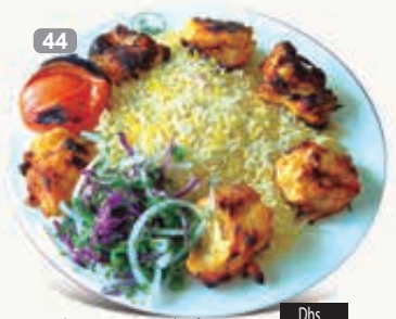
كباب جوجو مع ار Jojo Kabab with Rice Yoghurt & Green Salad Dhs. 31.50