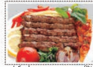
لحم كباب MUTTON KEBAB Dhs. 25.50