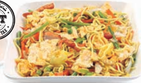
معكرونه مشكل MIX NOODLES Dhs. 19/26.50