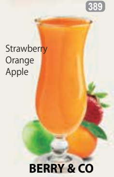
Strawberry Orange Apple