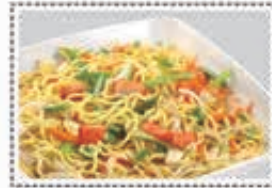
معكرونه دجاج CHICKEN NOODLES Dhs. 16/23