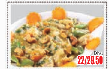
دجاج مع الكاشيو CHICKEN CASHEWNUITS Dhs. 22/29.50