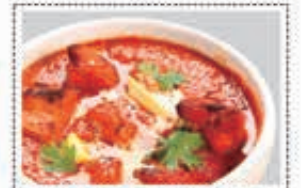
دجاج تكة مسالا CHICKEN TIKKA MASALA Dhs. 21.00