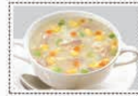
شورية دجاج ذرة حلو SWEET CORN SOUP