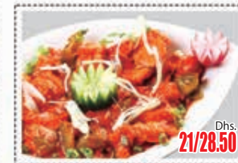
دجاج بالبصل و كابسيكم CHICKEN ONION WITH CAPSICUM Dhs. 21/28.50