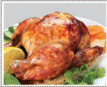
دجاج مشوي GRILLED CHICKEN Dhs. 16/26