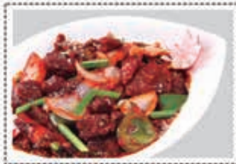
لحم بقر شيزوان