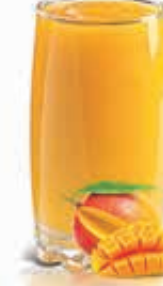
MANGO Dhs. 10.50/13