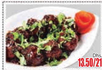
خضار منشوريان VEGETABLE MANCHURIAN Dhs. 13.50/21