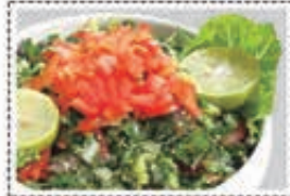
تبول TABULAH Dhs. 8.50

* Customers allergenic to certain food ingredients may please inform us * The above pictures are for illustrious purpose. It may vary in actual presentation