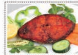
سمك كنعد مقلي KING FISH FRY Dhs. 12.00