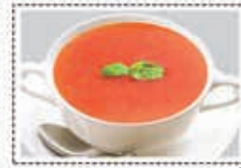
شورية طماط TOMATO SOUP