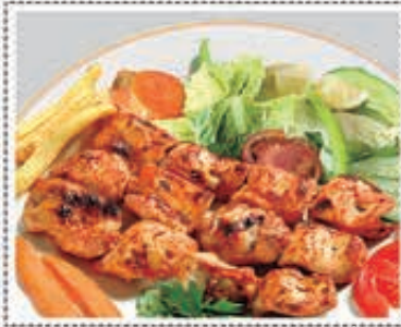
شيش طاووق SHEESH TAWOOK Dhs. 25.50