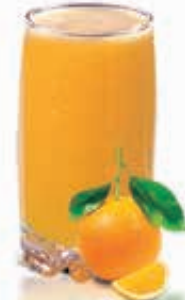
ORANGE Dhs. 10.50/13