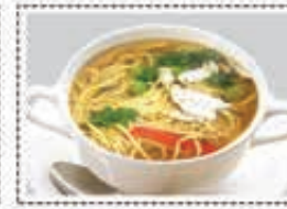
شورية دجاج معكرون CHI. NOODLES SOUP