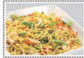
معكرونه خضار VEGETABLE NOODLES Dhs. 13.50/21