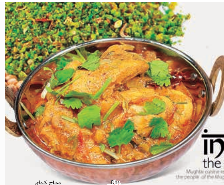
دجاج كدائي CHICKEN KADAI Dhs. 17.00

* Customers allergic to certain food ingredients may please inform us * The above pictures are for illustrious purpose. It may vary in actual presentation