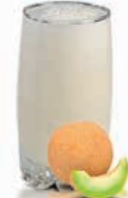
SWEET MELON Dhs. 10.50/13