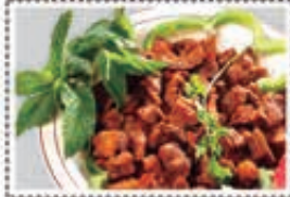
لحم ناش MEAT NASHIF Dhs. 24.50