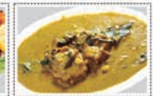
سمك مولي (كنعد) FISH MOLI (KING FISH) Dhs. 17.00

* Customers allergic to certain food ingredients may please inform us * The above pictures are for illustrious purpose. It may vary in actual presentation