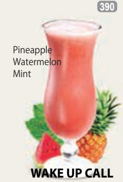
Pineapple Watermelon Mint