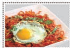
شوبسي امريكي AMERICAN CHOPUSEY Dhs. 21/28.50