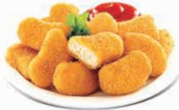
صحن قطع NUGGETS PLATE Dhs. 12/20