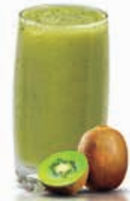
KIWI Dhs. 10.50/13