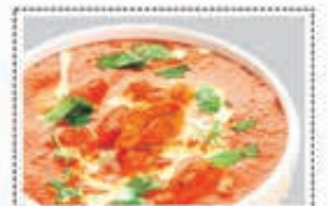
دجاج بالزبد بدون عظم CHI. BUTTER BONELESS Dhs. 20.00