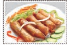
لفائف ربيع خضار VEGETABLE SPRING ROLL Dhs. 18.00