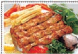
دجاج كباب CHICKEN KEBAB Dhs. 25.50