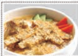
لحم كورما MUTTON KURUMA Dhs. 18.00

* Customers allergenic to certain food ingredients may please inform us * The above pictures are for illustrious purpose. It may vary in actual presentation