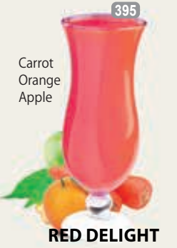
Carrot Orange Apple