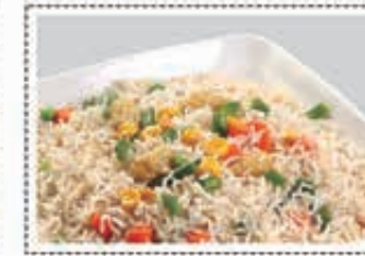
ارز مقلي خضار VEGETABLE FRIED RICE Dhs. 13.50/21