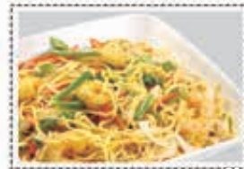
معكرونه روبيان PRAWNS NOODLES Dhs. 19/26.50