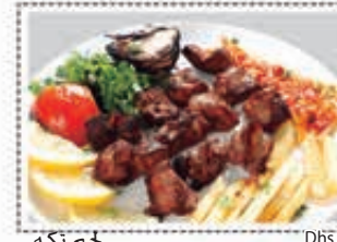
لحم تكة MUTTON TIKKA Dhs. 25.50