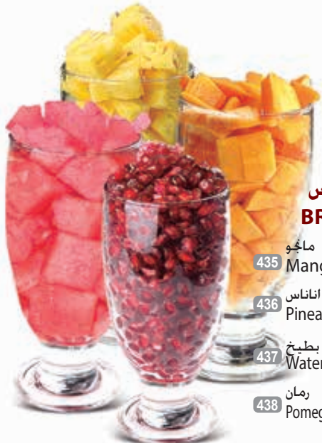
بريكس BRICKS 435 Mango Dhs. 16.00 436 Pineapple Dhs. 16.00 437 Watermelon Dhs. 14.00 438 Pomegranate Dhs. 16.00