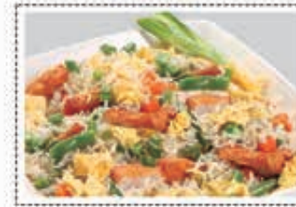
ارز مقلي دجاج CHICKEN FRIED RICE Dhs. 16/23