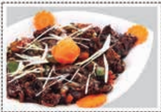
لحم بقر ثوم و فلفل DRY BEEF GARLIC & PEPPER

* Customers allergenic to certain food ingredients may please inform us * The above pictures are for illustrious purpose. It may vary in actual presentation