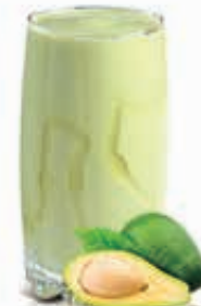
AVOCADO Dhs. 10.50/13