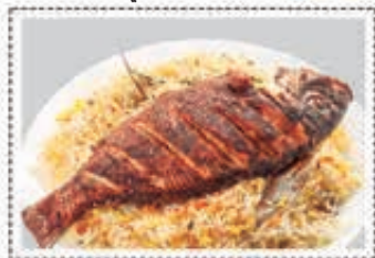
برياني سمك FISH BIRIYANI