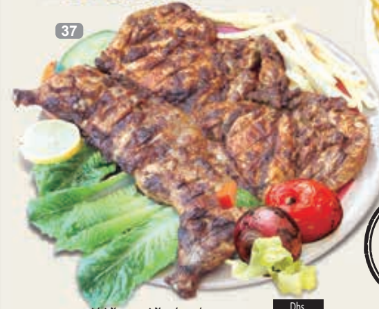
دجاج على الفحم بالفلفل Chicken Charcoal Pepper Dhs. 26/48