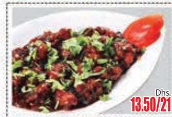
قرنبيط منشوريان MANCHURIAN CAULIFLOWER Dhs. 13.50/21