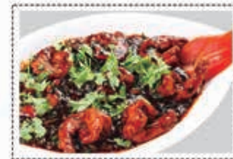
روبيان منشوريان PRAWNS MANCHURIAN Dhs. 24.50/36