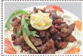
حمص مع لح HAMMOUS MEAT Dhs. 25.50