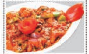
دجاج ثوم GARLIC CHICKEN Dhs. 21/27.50