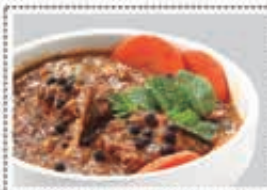
لحم فلفل MUTTON PEPPER Dhs. 19.00