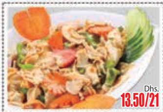
ملفوف مقلي بالرعشة + فطره خيزران شوت STIR FRIED CABBAGE + MUSHROOM Dhs. 13.50/21

* Customers allergic to certain food ingredients may please inform us * The above pictures are for illustrious purpose. It may vary in actual presentation