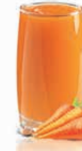
CARROT Dhs. 10.50/13