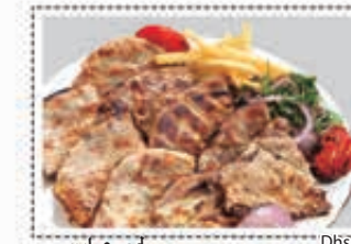
لحم عرايس MUTTON ARAYES Dhs. 25.50

* Customers allergenic to certain food ingredients may please inform us * The above pictures are for illustrious purpose. It may vary in actual presentation