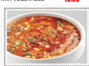
نفاثرن كورما NAVARATHNA KURUMA Dhs. 14.00