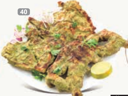
دجاج فلفل اخضر على الفحم اخض Green Chilly Chicken Charcoal Served with Hummus & Green Salad Dhs. 24/46