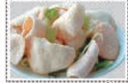
روبيان كراكر PRAWNS CRACKERS Dhs. 15.00