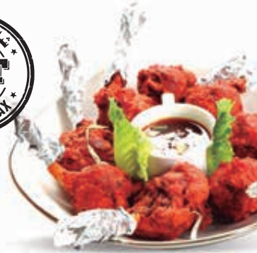
دجاج لولي بوب CHICKEN LOLLIPOP Dhs. 20.00