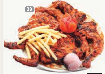
دجاج تندوري حار Chicken Tandoori Spicy Served with Hummus & Green Salad Dhs. 26/48