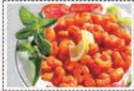
روبيان ناش SHRIMPS NASHIF Dhs. 29.50