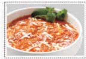
بانير زبدة مسالا PANEER BUTTER MASALA Dhs. 14.00