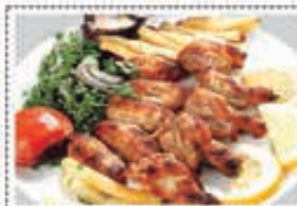
دجاج جواتح CHICKEN WINGS Dhs. 25.50