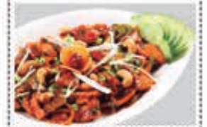
دجاج هونغ كونغ HONG KONG CHICKEN Dhs. 23/29.50

* Customers allergenic to certain food ingredients may please inform us * The above pictures are for illustrative purpose. It may vary in actual presentation