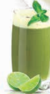
LEMON MINT Dhs. 8.50/10.50