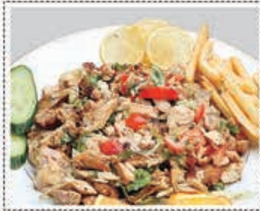
صحن شاورما دجاج CHICKEN SHAWARMA PLATE Dhs. 26.50