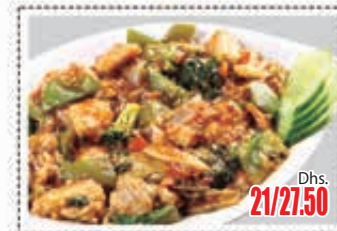
دجاج مع خضار متنوع صلصة الحار CHICKEN WITH ASSORTED VEG. IN OYSTER SAUCE Dhs. 21/27.50