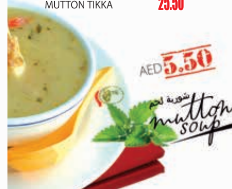
AED 5.50 شوربة لحم mutton soup