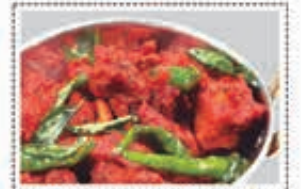
دجاج ٦٥ جا CHICKEN 65 DRY Dhs. 18.00

* Customers allergic to certain food ingredients may please inform us * The above pictures are for illustrious purpose. It may vary in actual presentation