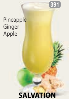
Pineapple Ginger Apple