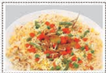
برياني خضار VEGETABLE BIRIYANI