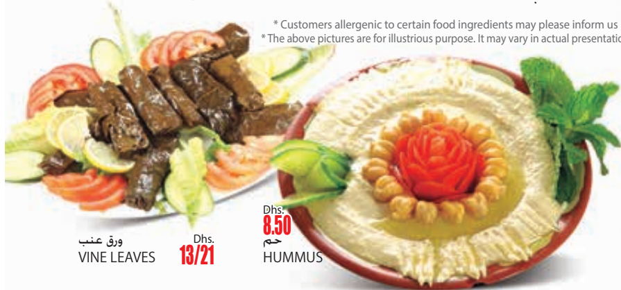
ورق عنب VINE LEAVES Dhs. 13/21

* Customers allergenic to certain food ingredients may please inform us * The above pictures are for illustrious purpose. It may vary in actual presentation