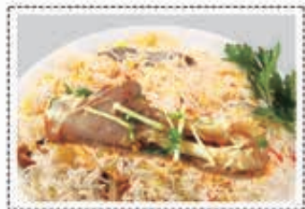
برياني لحم MUTTON BIRIYANI