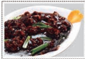
لحم بقر منشوريان