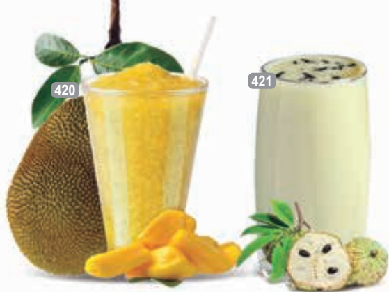
عصير جاك فروت Dhs. 10/12 تفاح الكسترد Dhs. 13/15

* Customers allergenic to certain food ingredients may please inform us * The above pictures are for illustrious purpose. It may vary in actual presentation